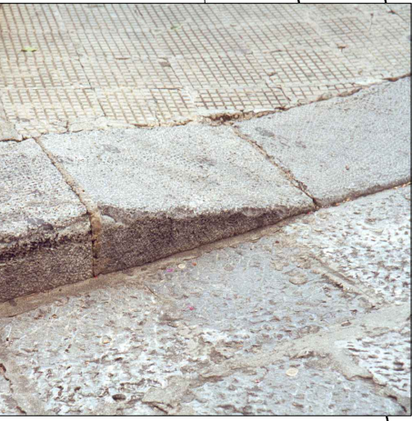
LASTRICATO IN MARMETTE DI CEMENTO DIMENSIONI CM. 18 X 18 GRADINO CON: ORLATURA IN BASOLE DI LUMACHELLA BICOCCARDATA A GRANA FINE DIMENSIONI CM. 38-40 X 50-60 H= CM. 18