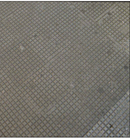
PAVIMENTO IN MARMETTE DI CEMENTO DIMENSIONI CM. 18 X 18